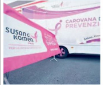
La Carovana della prevenzione

Il parcheggio dei supermercati Despar del Sud si trasformerà in centri per la prevenzione contro i tumori. Oggi a Corato dalle 9,30 alle 16,30 nel parcheggio del punto vendita Despar, in via Gravina, si potranno eseguire