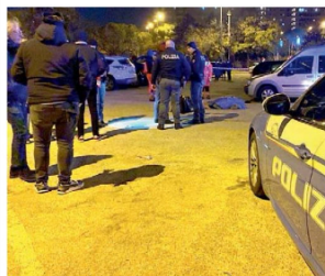
▲ Il luogo del delitto | rilievi dopo l'omicidio