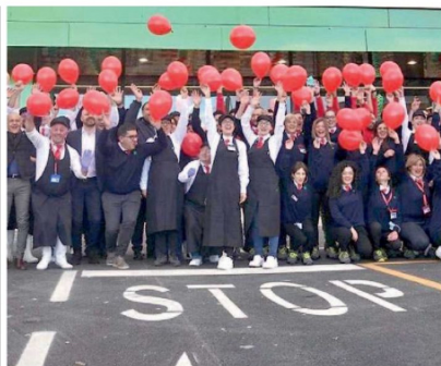
▲ In festa Un gruppo di dipendenti davanti a un punto vendita Maiora

«Questo progetto rappresenta un ulteriore passo significati-