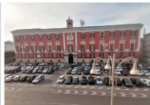
▲ Dall'alto il palazzo della prefettura