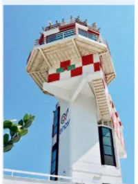
▲ A Brindisi La torre di controllo