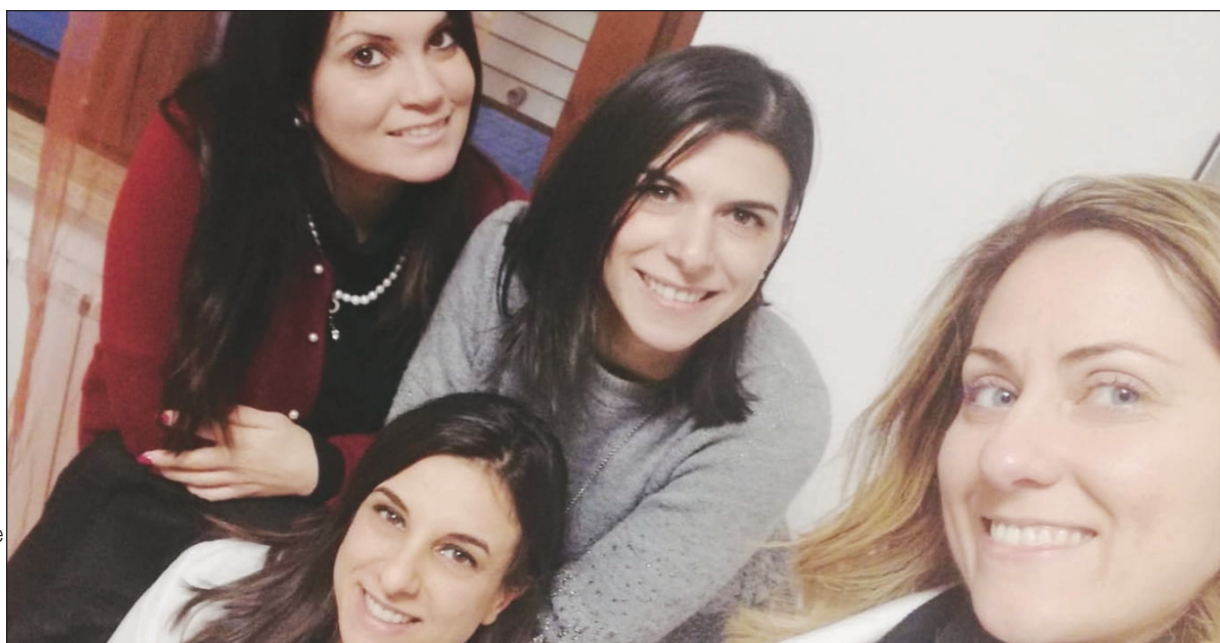
Le dottoresse volontarie dell'Associazione Disturbi Alimentari Cosenza