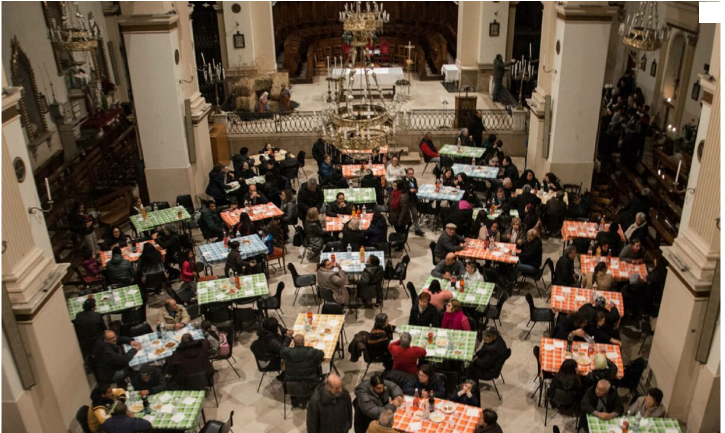
Le cene della solidarietà

In 12 Comuni del Centro-Sud una grande tavola imbandita per i meno fortunati, senza tetto e richiedenti asilo, promossa da Despar Centro-Sud, in collaborazione con i referenti parrocchiali Caritas dei centri coinvolti