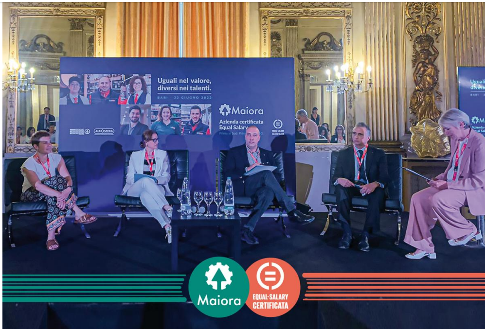
Maiora Tavola Rotonda