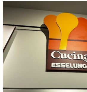
Esselunga raggruppa e segmenta le sue eccellenze nel brand 'Cucina Esselunga' 26 Ottobre 2022 - 09:21