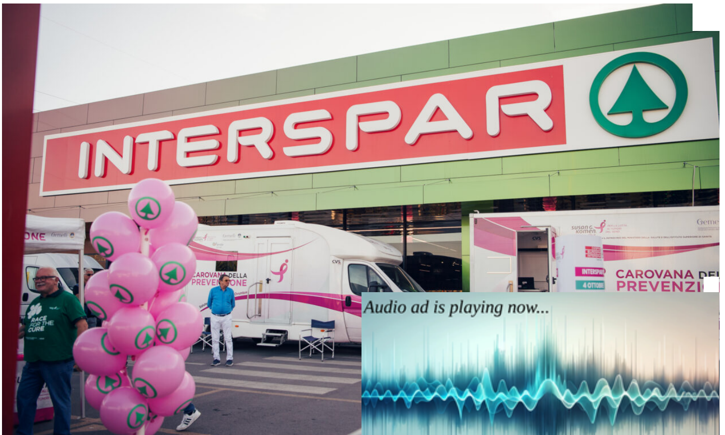
Carovana della prevenzione Interspar

Il 9 ottobre presso l'Interspar di Via Gravina screening per gli uomini: Maiora sostiene per il terzo anno il progetto itir