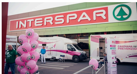
Carovana della Prevenzione

Torna anche quest'anno, in occasione del mese dedicato alla prevenzione, la preziosa collaborazione tra Maiora , tra le principali aziende della GDO nel centro-sud Italia con l'insegna Despar , e Komen Italia , attiva dal 2000 e in prima linea nella lotta ai tumori al seno con " La Carovana della Prevenzione ", il Programma Nazionale Itinerante di Promozione della Salute (ideato congiuntamente alla Fondazione Policlinico A. Gemelli IRCCS). Il duplice obiettivo riguarda non solo la disponibilità di screening gratuiti per prevenire i tumori di genere, ma anche l'ampia attività di sensibilizzazione sul tema.