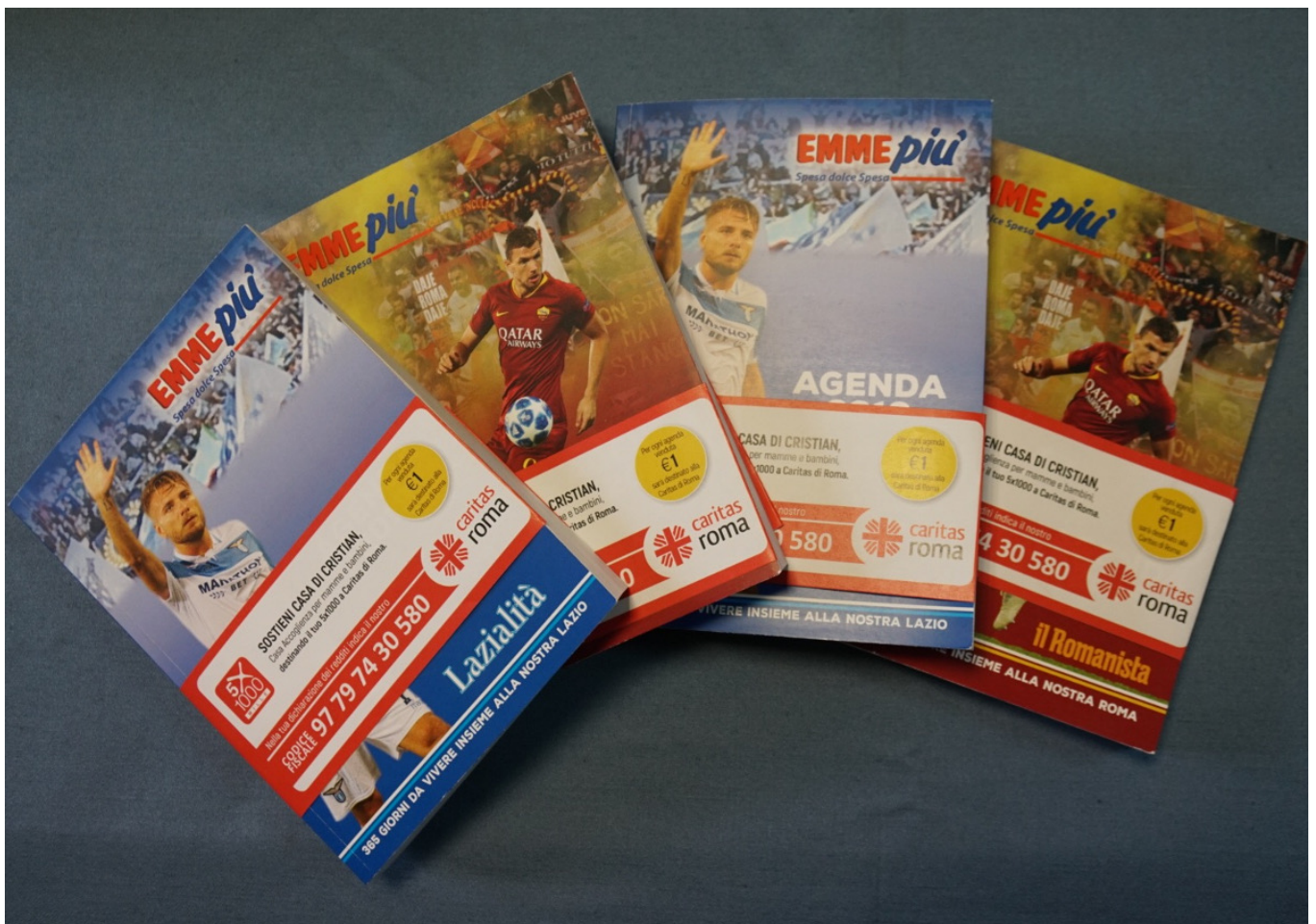
Le agende di EmmePiù

Per il Natale 2018, i supermercati Emme Più, società del Gruppo Maiorana , hanno ideato e creato, insieme alle riviste Lazialità e Il Romanista , due agende per i tifosi e simpatizzanti delle due squadre capitoline. L'agenda di 340 pagine potrà essere acquistata in tutti i punti vendita Emme Più e parte del ricavato andrà a sostegno del centro di prima accoglienza della Caritas di Roma, Casa di Cristian . La struttura accoglie mamme con bambini che si trovano in condizioni di precarietà sociale, alloggiativa, familiare ed economica. Solo nell'ultimo anno sono state accolte 29 mamme e 32 bambini in stato di fragilità sociale .