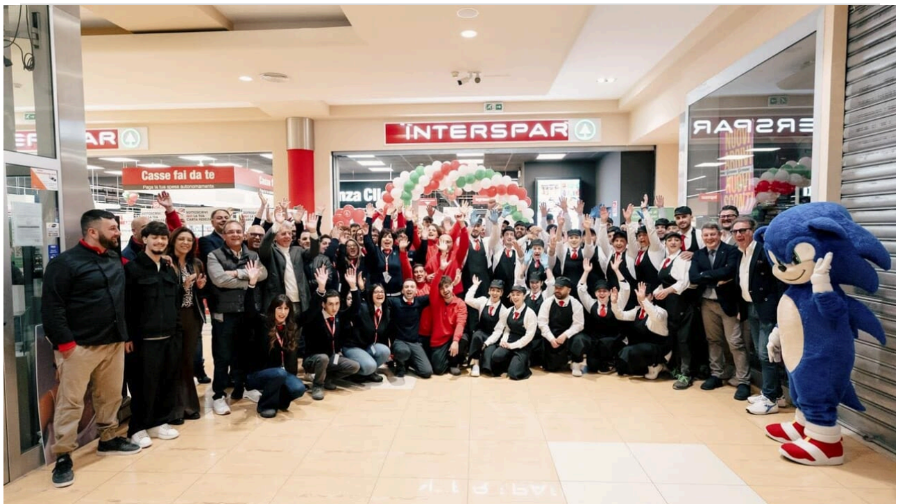
Una foto di gruppo