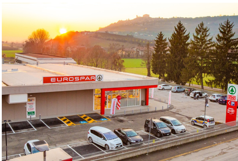
Guarda la gallery

Maiora, dunque, rappresenta l'espressione di un'impreditoria sana e attenta al territorio e si è dimostrata ampiamente capace di generare valore per la società nella quale opera, potenziando costantemente placement e benessere.