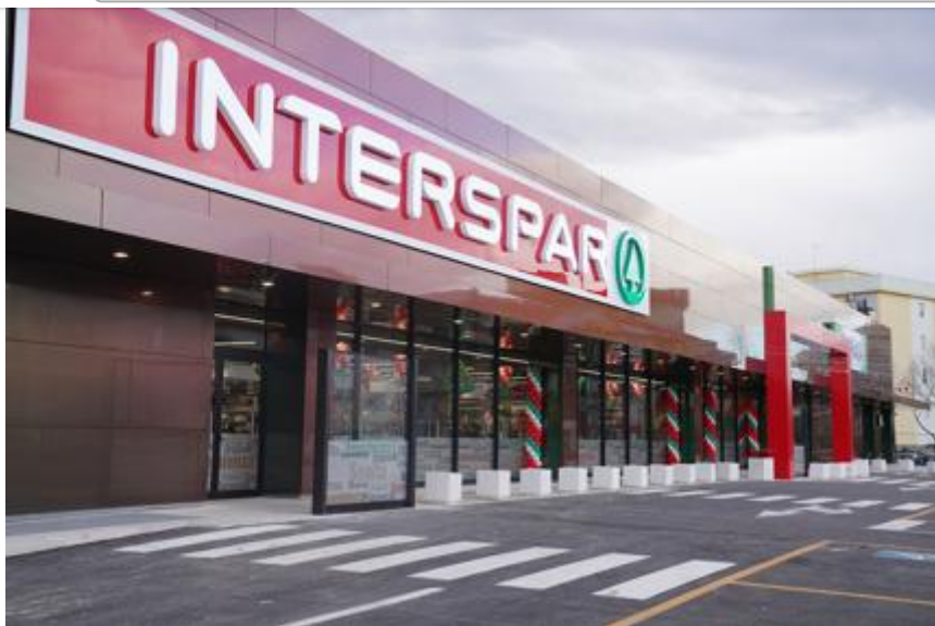
esterna Interspar (1)