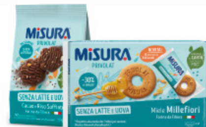
BISCOTTI PRIVOLAT MISURA VARI TIPI 290G/400G