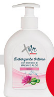
Detergente intimo XME delicato 300ml