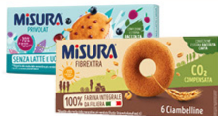
TORTINE PRIVOLAT MISURA 290G/ CIAMBELLINE INTEGRALI MISURA FIBREXTRA VARI TIPI 230G