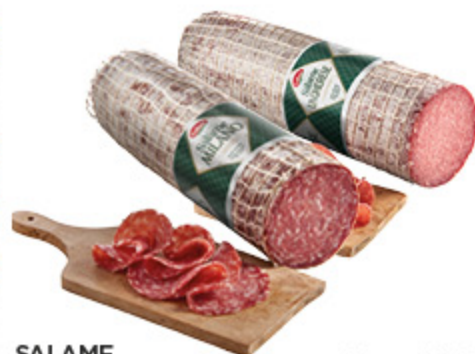
SALAME MILANO/ UNGHERESE GALBANI