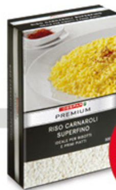
Riso carnaroli Premium 1kg