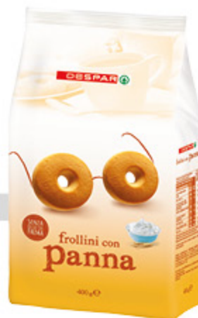
frollini despar con panna 400g