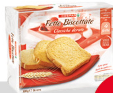
Fette biscottate DESPAR classiche dorate 320g