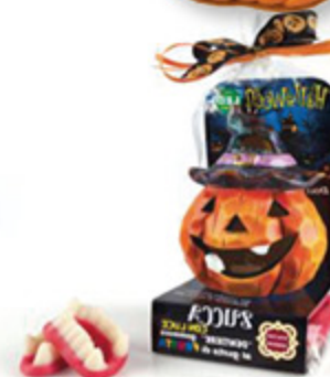
ZUCCA LUMINOSA CON CAMELLE DOLCERIE VENEZIANE 100G