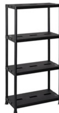
SCAFFALE UNIVERSALE PRO 4 RIPIANI PLASTMECC 75X35XH138