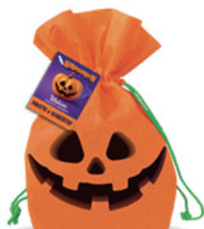
SACCHETTO MONETE HORRORWEEN 175G