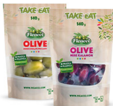
OLIVE FICACCI VARI TIPI 140/150G