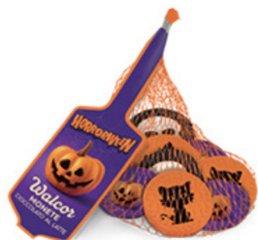
RETINA MONETE HORROR WALCOR 75G