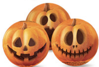
ZUCCA HORRORWEEN WALCOR 40G