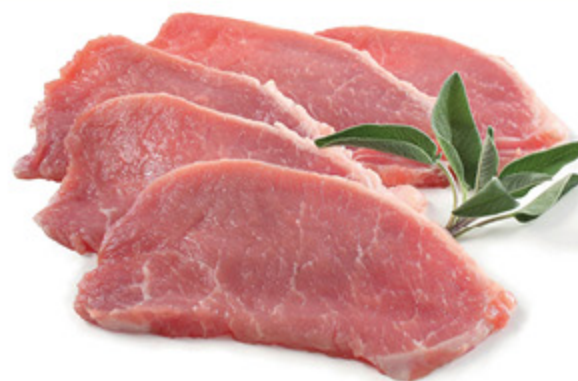
LONZA A FETTE DI SUINO CONFEZIONE RISPARMIO