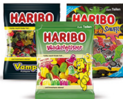
CARAMELLE HARIBO VARI TIPI 160/175G 1,19