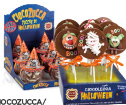
CIOCOZUCCA/ CIOCOLECCA HALLOWEEN DOLCERIE VENEZIANE 70G