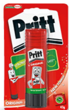
COLLA STICK PRITT 43G 2,90