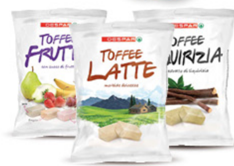
CARAMELLE DESPAR VARI TIPI 150G 1,19 7,95 €/KG