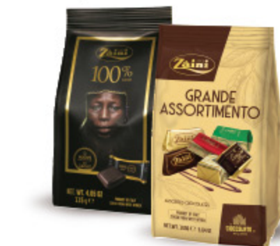
CIOCCOLATINI ZAINI VARI TIPI 115/160G 2,59