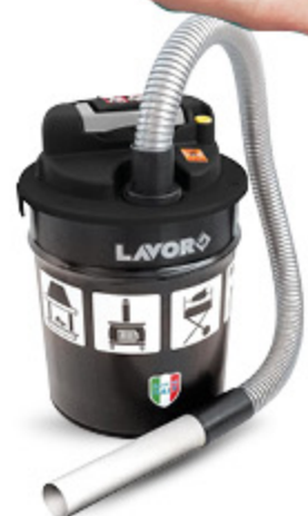
ASPIRACENERE 800W 180MBAR LAVOR 18L 39,90