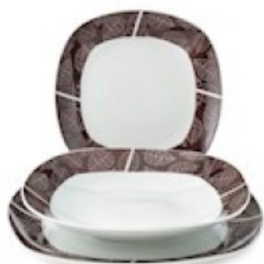
SV TAV.QUAD PCL MICHELLE PENGO 18PZ 24,90