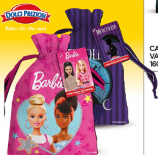
CANDY POKET BARBIE/ HOT WHEELS/ MERCOLEDÌ DOLCI PREZIOSI 170G 4,99 29,35 €/KG