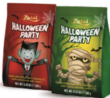
CIOCCOLATINI E CARAMELLE HALLOWEEN ZAINI VARI TIPI 185G 2,99 16,16 €/KG