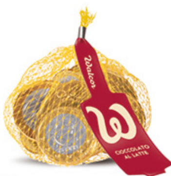
RETINA MONETE WALCOR 25G