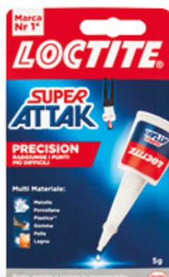
SUPER ATTAK WR PRECISION 5G 3,90