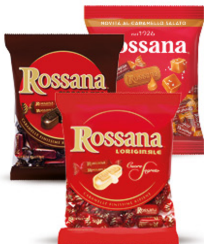
CARAMELLE ROSSANA VARI TIPI 150G 1,89 12,60 €/KG