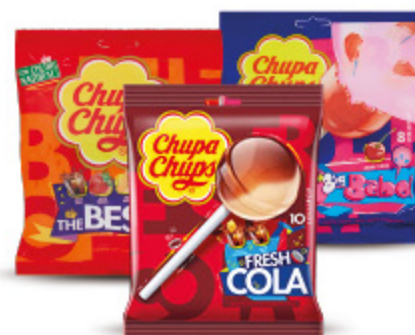
CHUPA CHUPS VARI TIPI 1,99