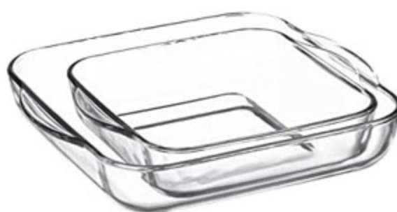
TEGAMI IN VETRO QUADRATI