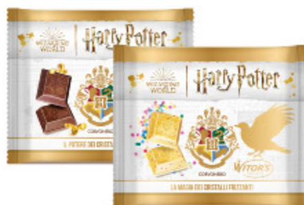
HARRY POTTER TAVOLETTA DI CIOCCOLATO AL LATTE VARI TIPI 50G