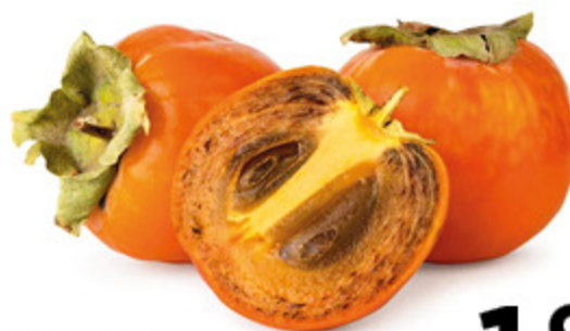
LOTI MATURI/ VANIGLIA