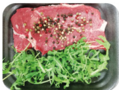
TAGLIATA TRICOLORE DI BOVINO