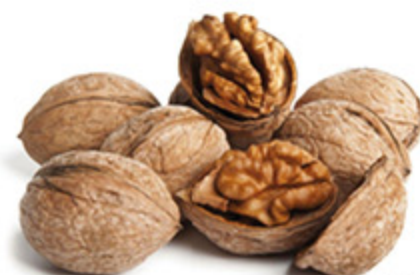
NOCI JUMBO CILE CONFEZIONE DA 750G