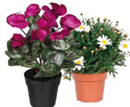
CICLAMINO/ MARGHERITA VASO 10CM