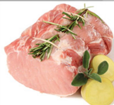
ARISTA DI SUINO ALLE ERBE