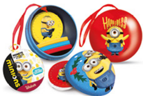
SFERA DI MONETE DI CIOCCOLATO WALCOR MINIONS/HELLO KITTY 30G