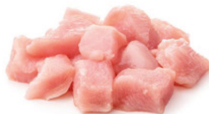
STRACCETTI/ BOCCONCINI DI PETTO DI POLLO